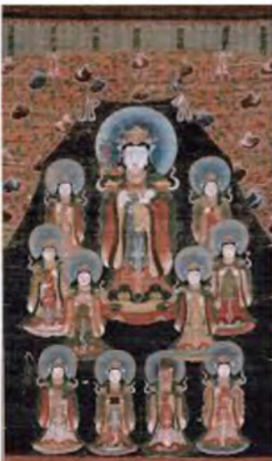
法華守護 鬼子母神・十羅刹女図 (愛知県・長満寺蔵)

御会式法要では、鬼子母神様、とその眷属十羅刹女様十体のご尊像の修復後の御開帳を予定しております。各々高さ二十cm、迫力ある江戸時代当初の美しいお姿を是非、拝していただければ幸いです。『てらうどファンディング』と称した修復事業に、ご協力いただいた多くの檀信徒様には、心より御礼申し上げます。