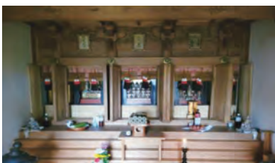
番神堂内部。中央の扉内で三十番神様をお祀りしています。右は鬼子母神様

「我々が、日代わりで法華経信者を護る」と頼もしく存在しておられる三十番神様ですが、明治期の廃仏毀釈により、室町く江戸時代の頃のような、信仰は少なくなっています。しかし、社会不安が強く、個々のよりどころが求められる中、神仏を信じ祈ることは大切だと感じています。當寺は「三十番神信仰の復興」を進めたいと考えております。